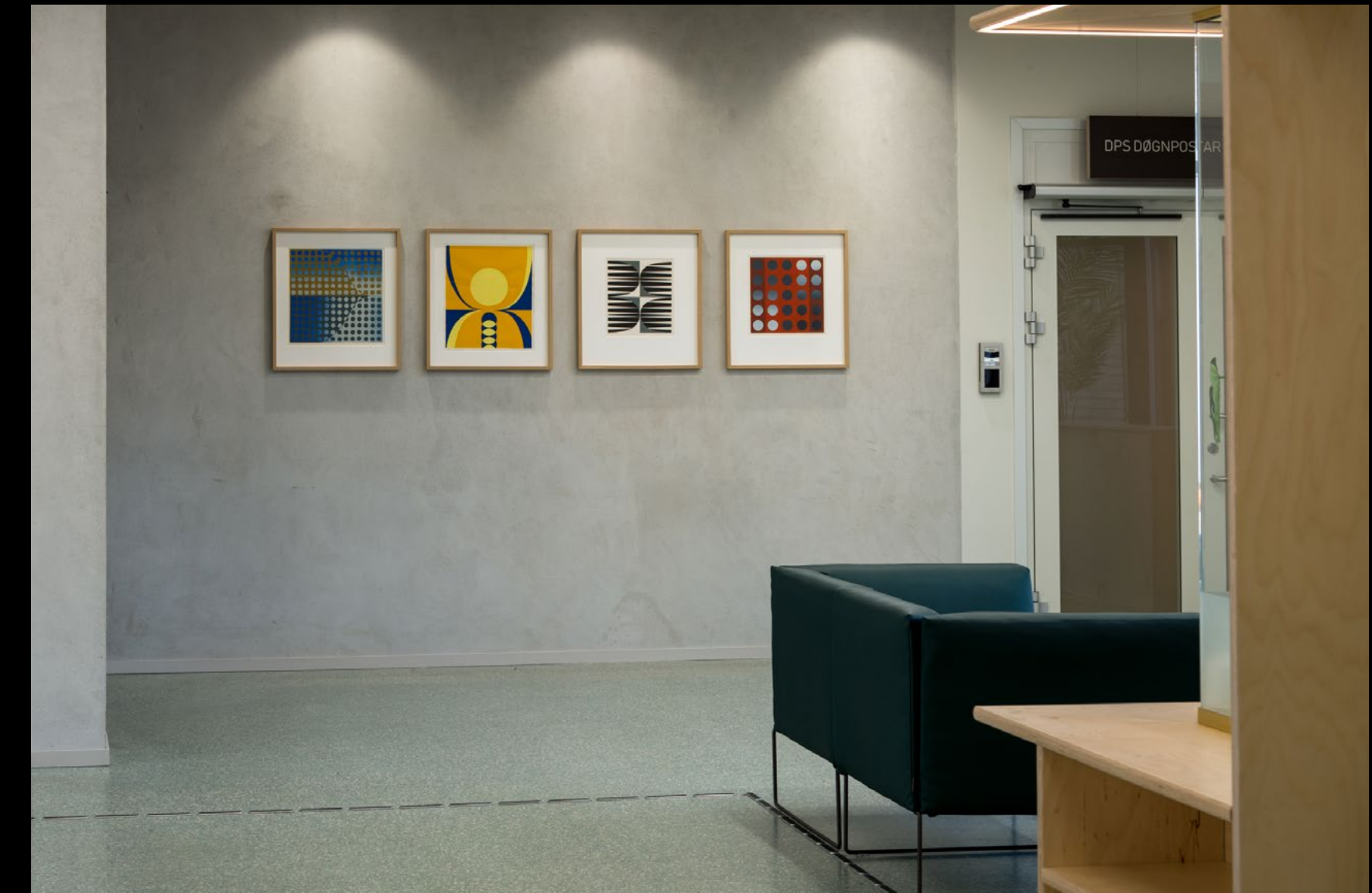
Aase Kvikne Bjordal