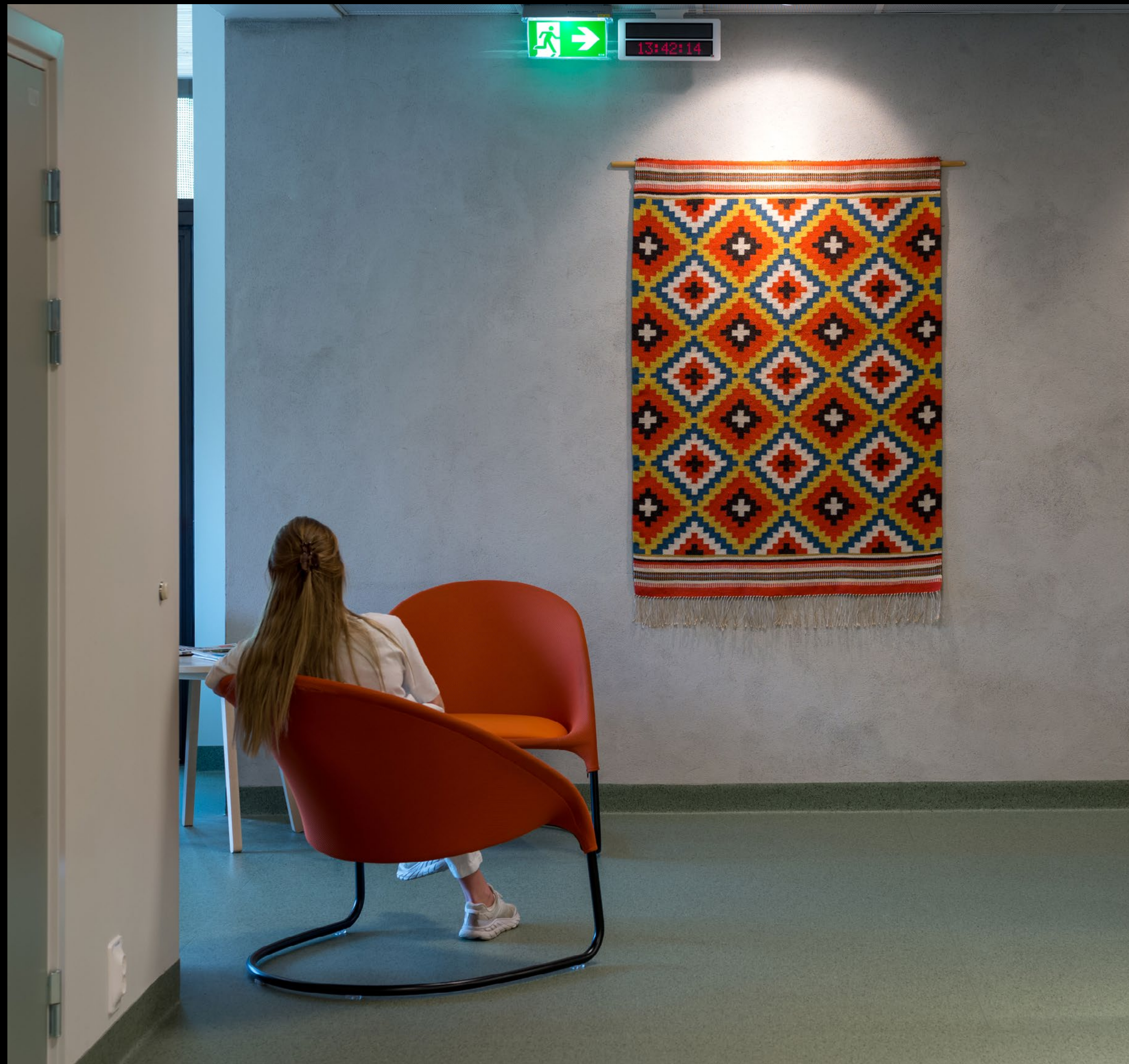
Veggeteppe «Jølster» av Magnhild Heggheim