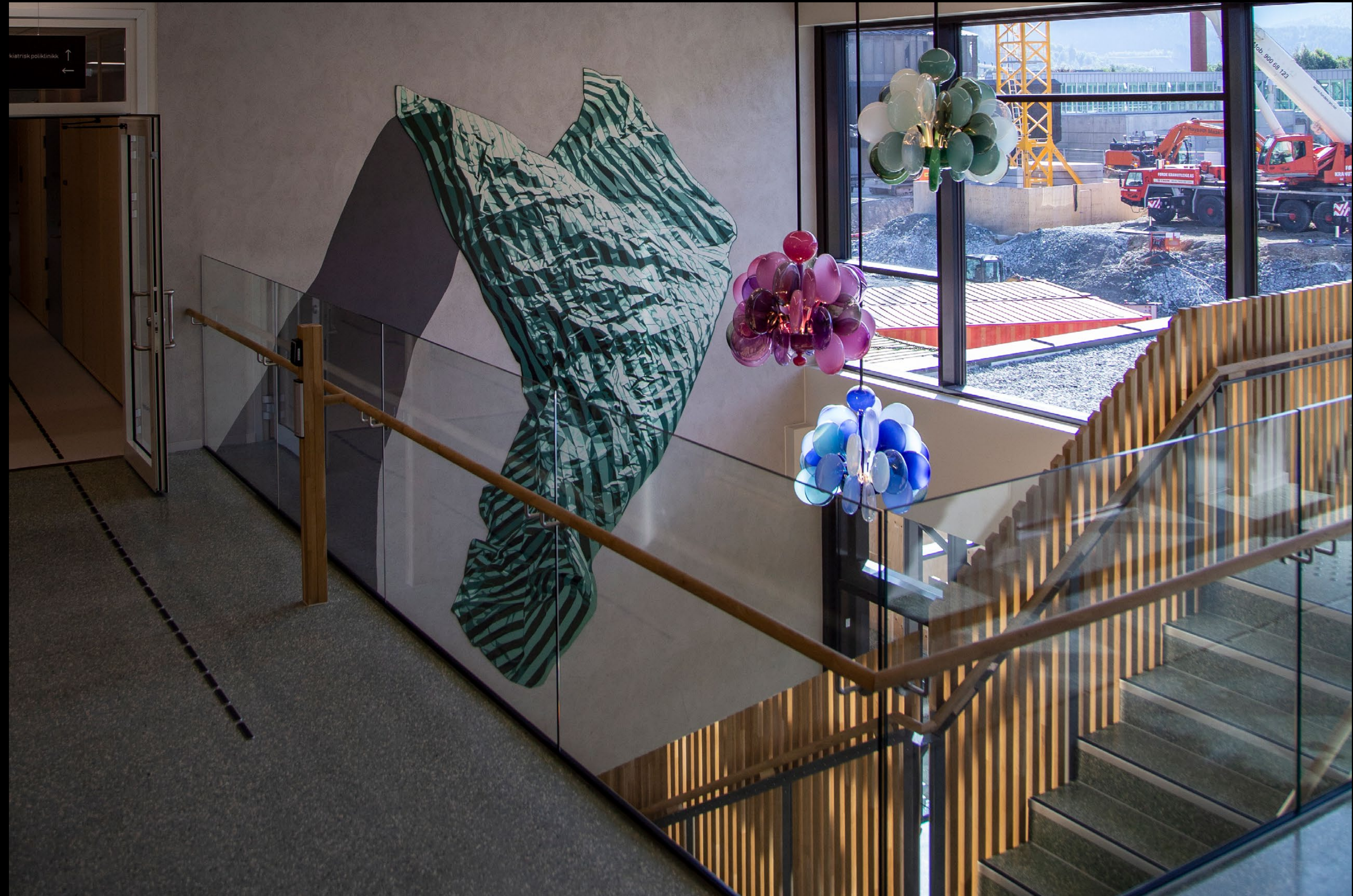
Anders Gjennestad, Uten tittel , 2021 Vidar Koksvik, Tre lysekroner , 2021