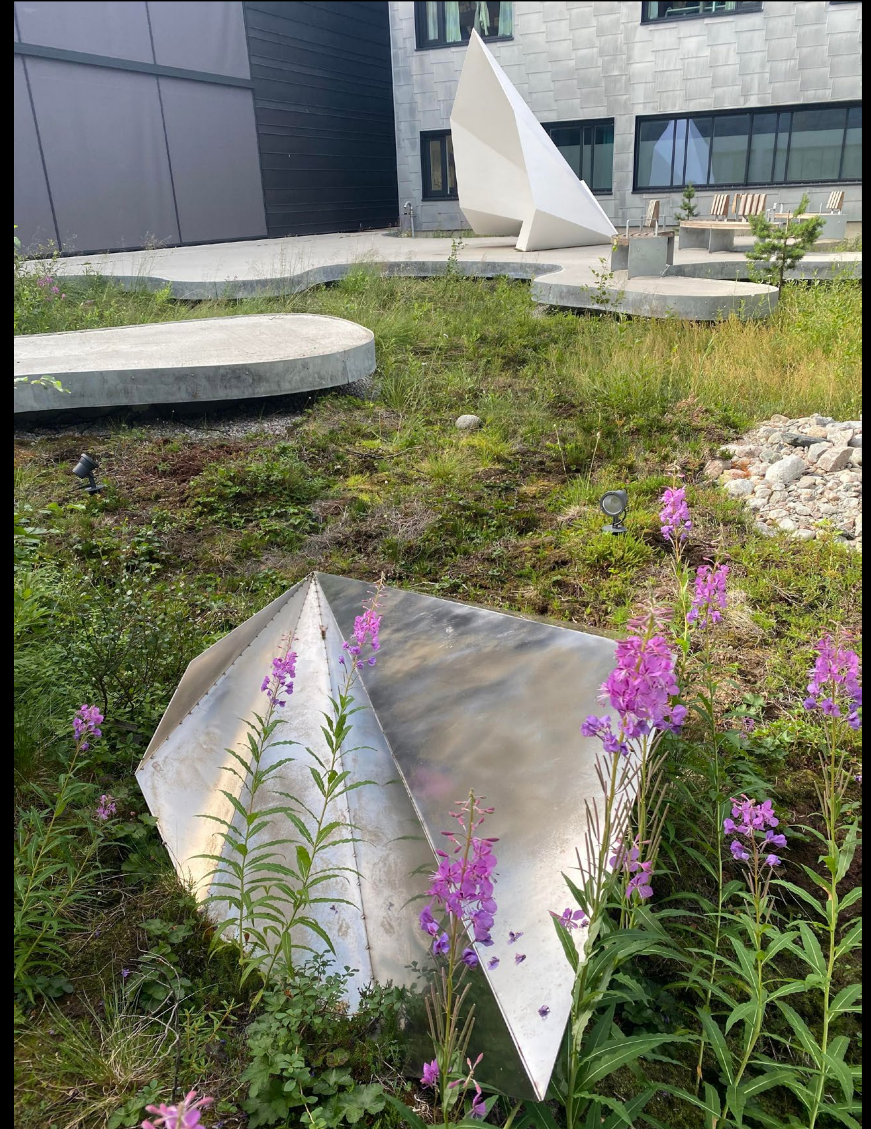
Signe Solberg, Dvale , 2017