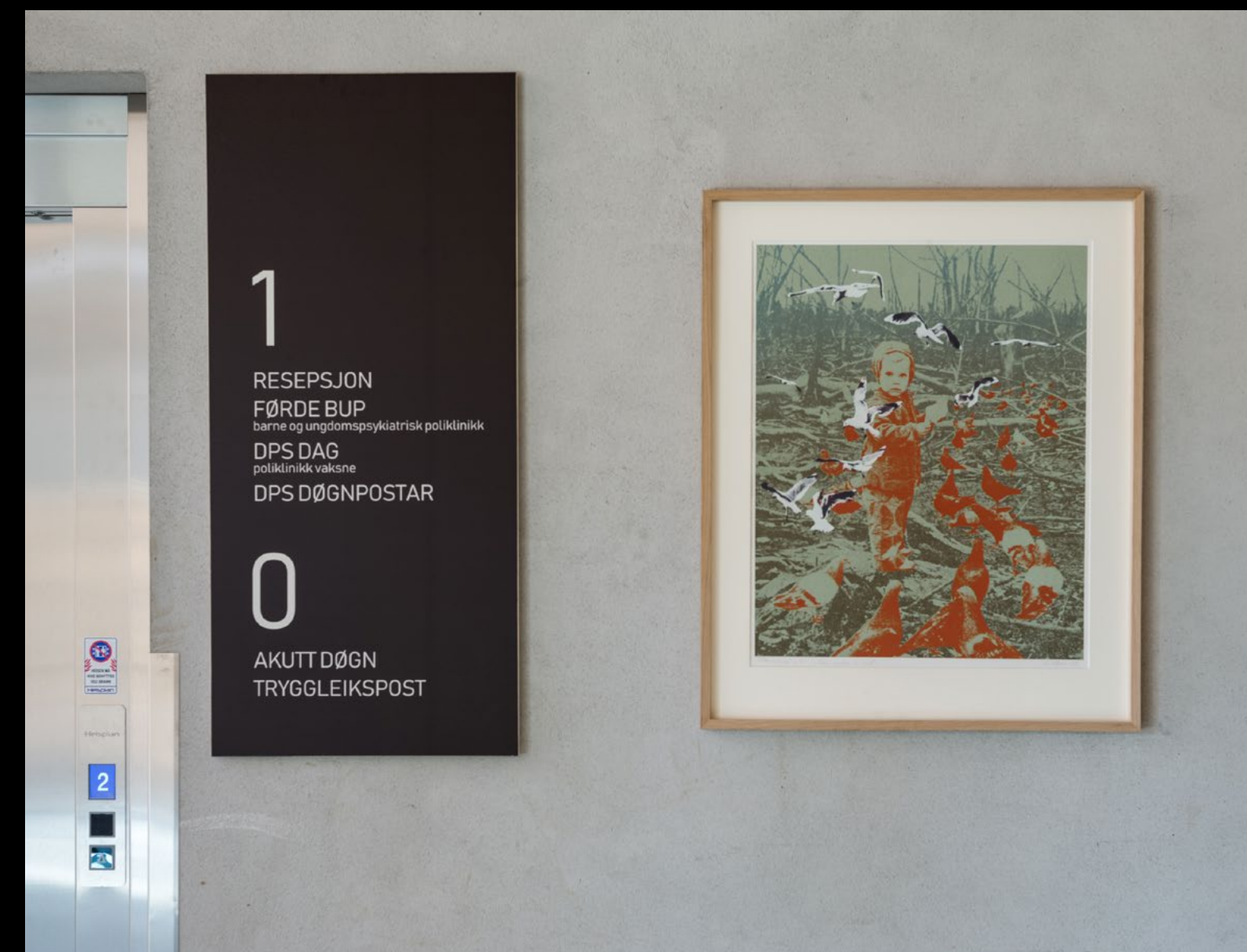
Per Kleiva, De voksne si verd , 1975